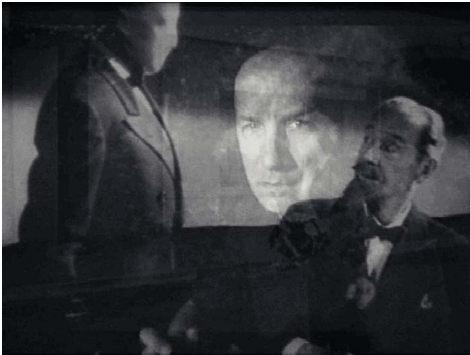
Photogramme tiré de la vidéo Chuck's Home Movies , 2009